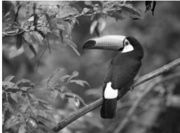
Figura 1 – Espécie rara de tucano